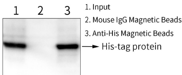
图2. BeyoMag™ Anti-His Magnetic Beads (Anti-His磁珠)用于His-tag融合蛋白的免疫沉淀效果图。样品1为Input，即原核表达的His-tag融合蛋白全细胞裂解液；样品2为Mouse IgG Magnetic Beads (小鼠IgG免疫磁珠) (P2171)免疫沉淀后经SDS-PAGE蛋白上样缓冲液(1X) (P0015A)洗脱后的样品，该Mouse IgG是正常的小鼠IgG (Normal Mouse IgG)，为阴性对照；样品3为本磁珠免疫沉淀后使用SDS-PAGE蛋白上样缓冲液(1X)洗脱的样品。Western印迹成像由BeyoImager™ 600化学发光成像系统完成(EI600)。实际结果会因实验条件、检测仪器等的不同而存在差异，图中数据仅供参考。